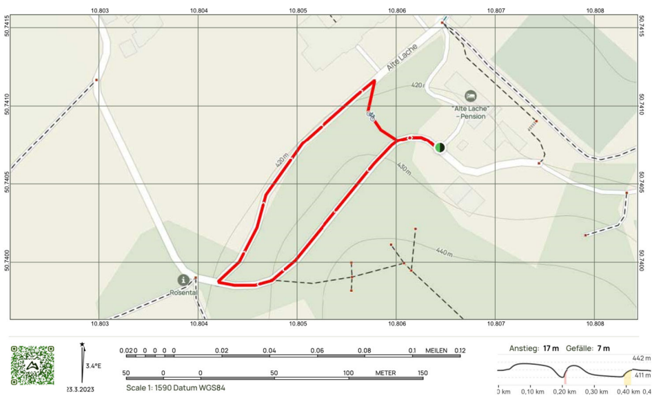
Bambinilauf Waldfest 480 m