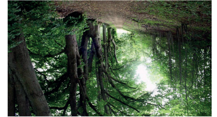
Thüringer Wald Zwischen 'Stockenhütte' und 'Stockenleich' am 'Thüringer Klimaweg Geraberg'

Gaststätte 3 Restaurant „Geratal-Klause“ Werner-Seelenbinder-Straße 50 99331 Geratal OT Geraberg (036277) 79 76 17 https://geratal-klause-geraberg-bei-ilmenau.business.site/