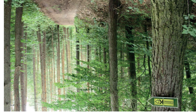
Foto: Alexandra Preuß, CC BY-SA, Thüringer Wald Zwischen 'Stockenhütte' und 'Stockenleich' am 'Thüringer Klimaweg Geraberg'

mail@thermometermuseum.de https://www.thermometermuseum.de/ Quelle: Thüringer Wald