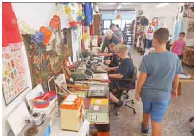
Im DDR-Museum erklärte Frau Geißler die alten Schreibmaschinen