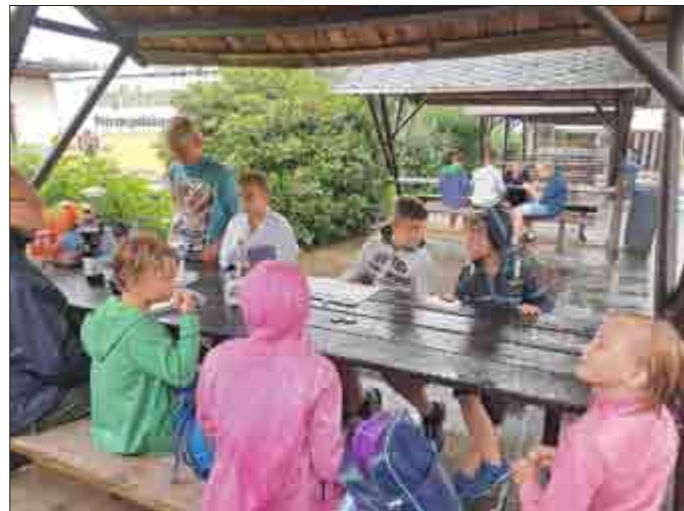
Am Bergsee Ratscher hatte es leider stark geregnet