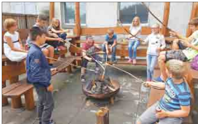
Beim gemeinsamen Essen im Jugendzentrum, hatte jeder seinen Spaß