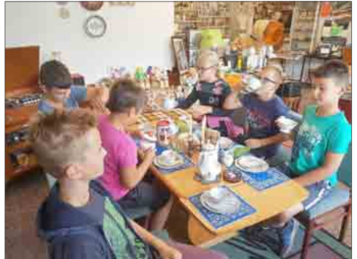
Viel Spaß gab es mit den alten Sachen im DDR-Museum