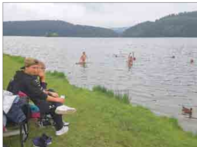
Auch wenn es einigen zu kalt war, die Mehrzahl badete im Bergsee Ratscher - danach ging es zur Kartbahn