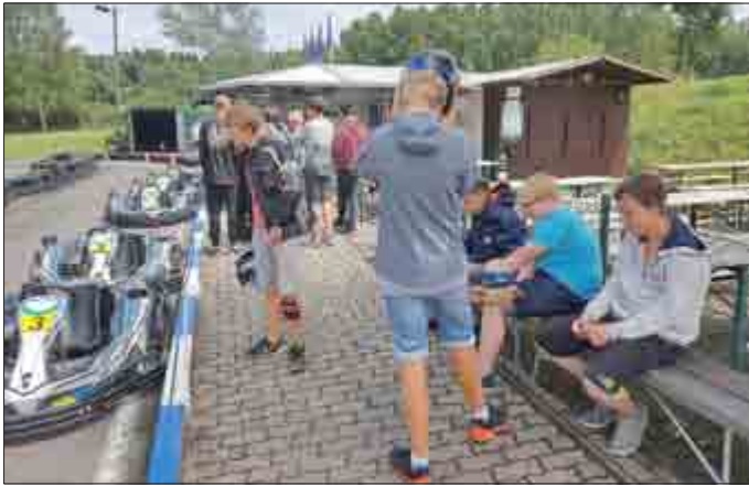
Glück hatten wir beim Kartfahren, der Regen hörte kurz vor dem Start auf und die Sonne schien